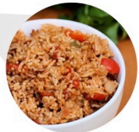
▲ RIZ ESPAGNOL (Livre de Cuisine des Accompagnements – p.34)