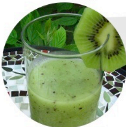
▲ SMOOTHIE KRAZY KIWII (Livre de Cuisine des Smoothies – p.15)