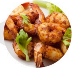
▲ CREVETTES AU PAPRIKA (Livre de Cuisine de Poisson et Crustacés – p.10)