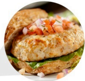
▲ BURGERS ASIATIQUES À LA DINDE (Livre de Cuisine de Poulet et Volailles p.4)