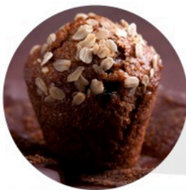
▲ MUFFINS AU CHOCOLAT BEURRE DE CACAHUÈTES ET AVOINE (Livre de Cuisine des Petits Déjeuners – p.24)