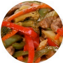
▲ SAUTÉ DE BŒUF AUX POIVRONS (Livre de Cuisine de Viande Rouge – p.23)